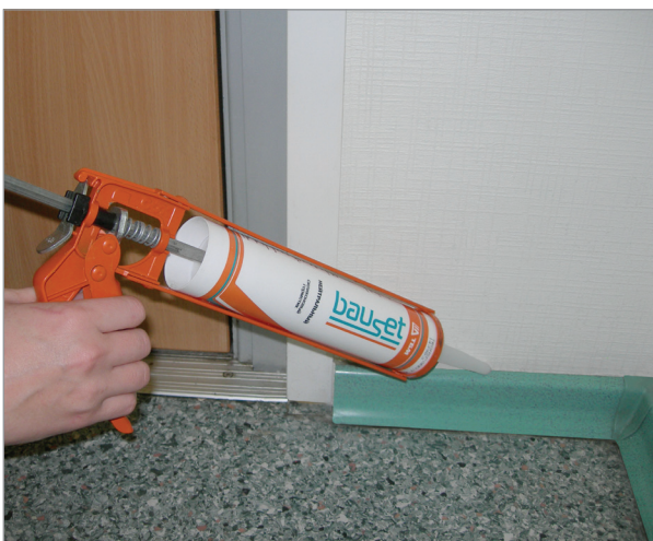
Герметизация швов в общестроительных работах