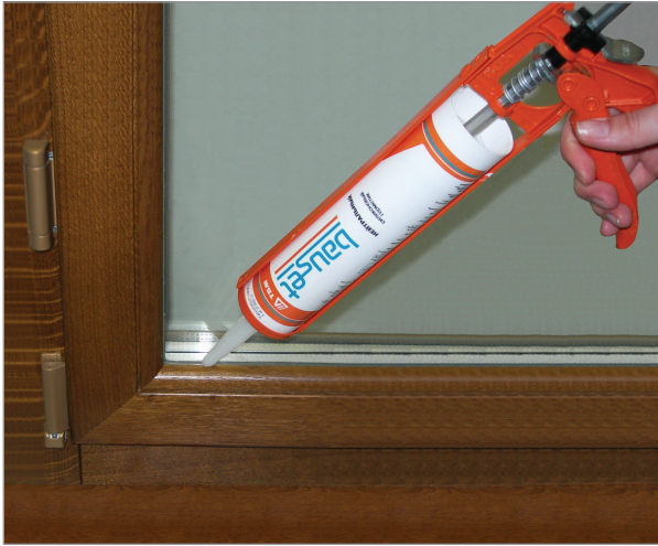
Герметизация между штапиком и стеклопакетом в деревянных окнах