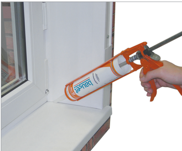
Герметизация швов при установке откосов

Могут использоваться без грунтовки внутри и снаружи помещений.